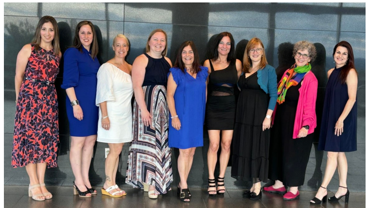
La délégation à la soirée sociale du congrès CSQ