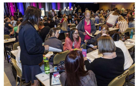
La délégation SERV en réflexion