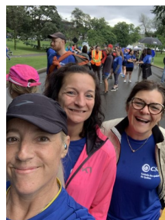
Jogging sous la pluie