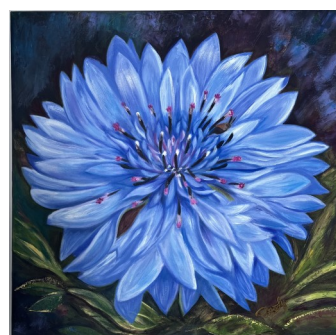
Page couverture arrière par Lyne Moreau

Grâce aux mille deux cents dollars (1 200,00 $) reçus des commanditaires du planificateur 2021-2022, nous avons fait un don de cent dollars (100,00 $) à chacun des organismes suivants : Monique Fitz-Back, Oxfam-Québec, Café de la Débrouille, Fondation Léa-Roback, Centraide Sud-Ouest du Québec, Fonds Robert-Saint-Louis, CAB Soulanges, Centre d'action bénévole l'Actuel, L'Aut'Journal . D'autres dons seront offerts à d'autres organismes d'ici juin 2022.