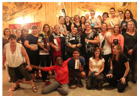
Les gagnants des prix de présence.