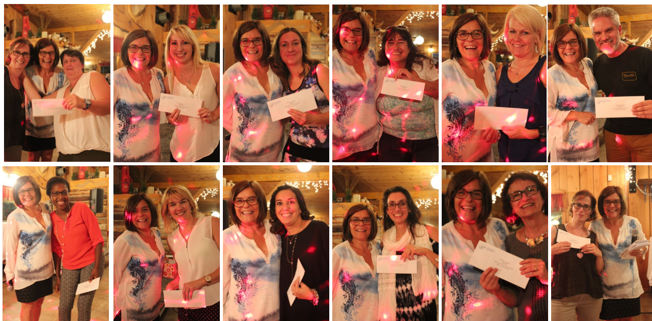
Les gagnants de la ristourne RésAut ont eu droit à 100 $ chaque.