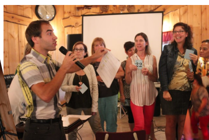
Ambiance de party!

Nous tenons à remercier Lili Therrien, notre fantastique photographe pour cette soirée!