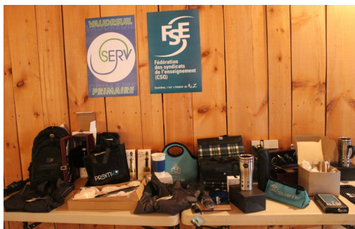
Les prix de présence.