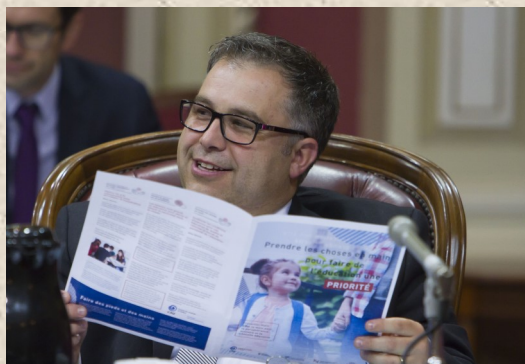
Le ministre de l'éducation Sébastien Proulx, intéressé par les positions de la CSQ.