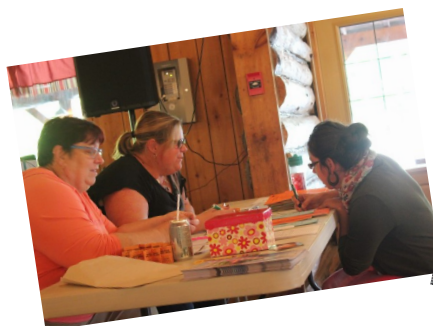
Nos bénévoles à l'accueil et au bar.